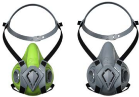
Medias máscaras BLS 4000 ne»xt S - BLS 4000 ne»xt R