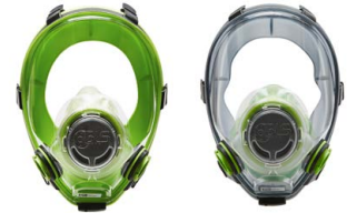
Máscaras completas BLS 5700 - BLS 5600