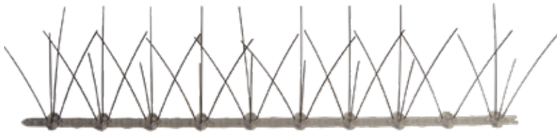
PLÁSTICO + INOX AISI304 - 50CM PMINOX-04