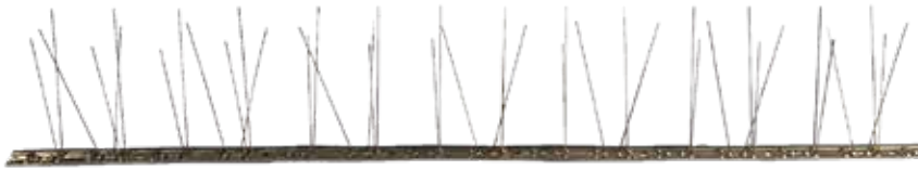
INOX AISI304 - 100CM PMINOX-03A