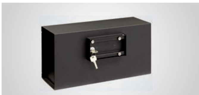
Retirando los enchufes accedemos a la cerradura de la caja.