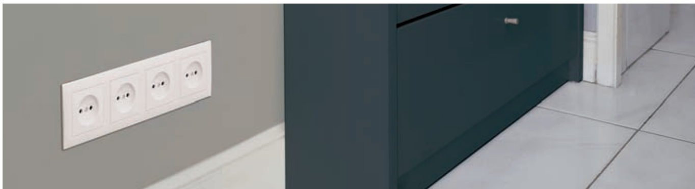
Puede ser ocultado en cualquier rincón de la vivienda o inmueble.