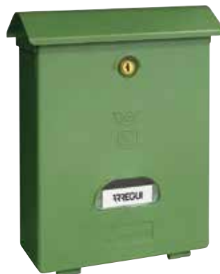
VERDE E1073 EAN-8425181721025