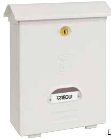
BLANCO E1071 EAN-8425181721247