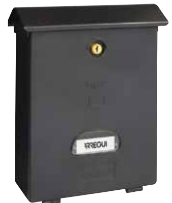
NEGRO E1074 EAN-8425181721032