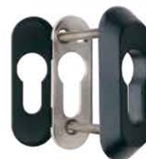
Detalle del escudo E210