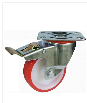
201/FDA POL A