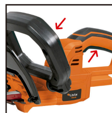
DOBLE BOTÓN DE SEGURIDAD