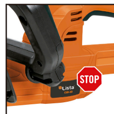
FRENO ELÉCTRICO DE CUCHILLAS