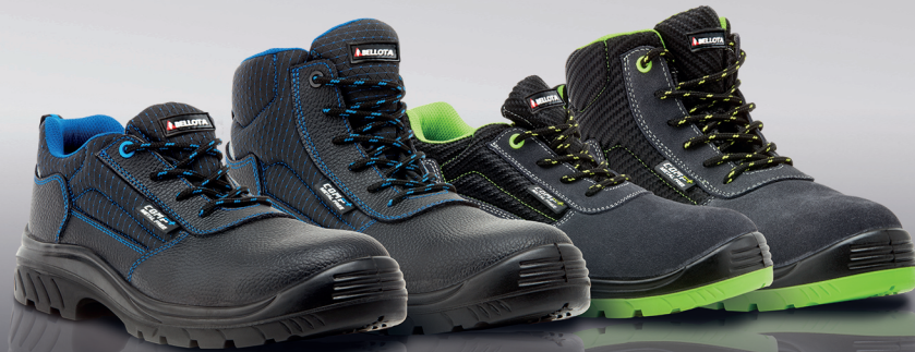
Ref. 72308 - S3 Zapato COMP+ S3

En Bellota seguimos innovando en tecnologías, materiales y en diseño para garantizar la protección y seguridad del usuario.