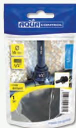
Presentación en bolsa