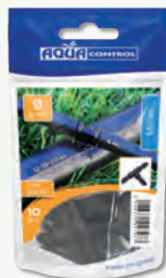
Presentación en bolsa