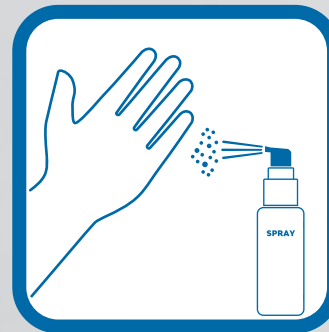
Aplica el Gel Higienizante en tus manos