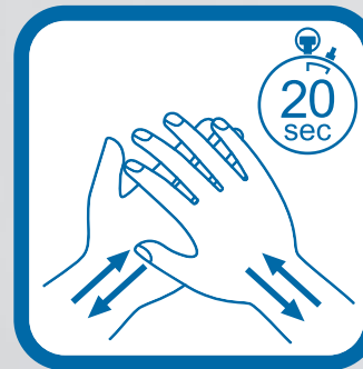
Frota tus manos durante 20 segundos