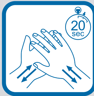
Frota tus manos durante 20 segundos