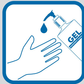
Aplica el Gel Higienizante en tus manos