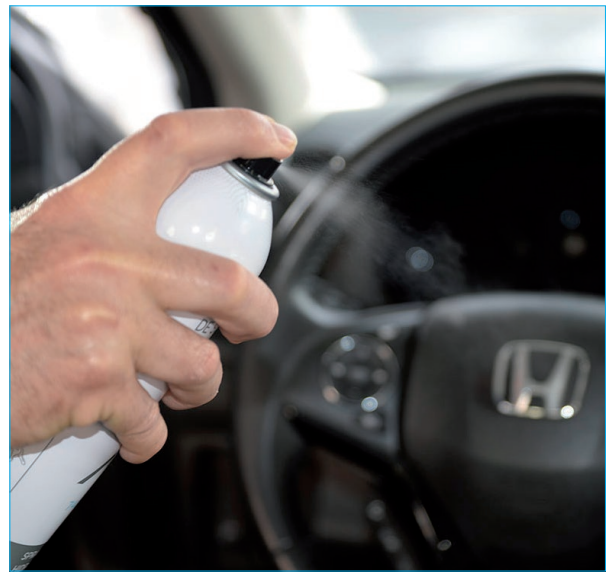
Limpeza de vehículos