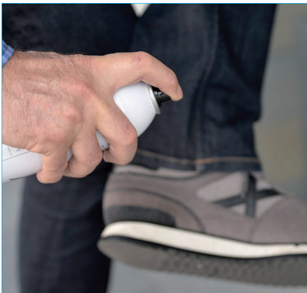
Prendas de vestir y calzado