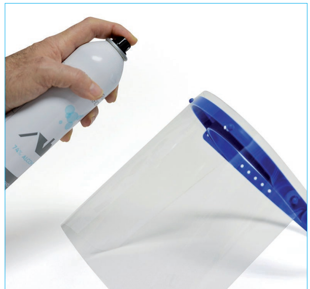
Elementos de protección