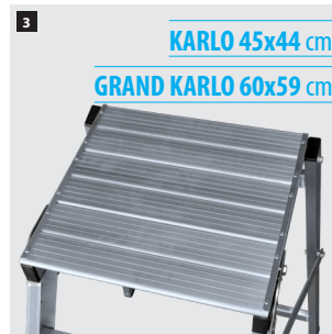
3 KARLO 45x44 cm GRAND KARLO 60x59 cm Plataforma de trabajo con relieves antideslizantes. Work platform with anti-slip reliefs. Plate-forme de travail avec des reliefs antidérapants. Plataforma de trabalho com relevos antiderrapantes.