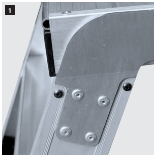
1 Bisagras de acero. Steel hinges. Charnières en acier. Dobradiças de aço