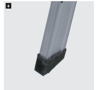
4 Tapafinal de PVC con relieves antideslizantes. PVC end cap with anti-slip reliefs. Patin en PVC avec reliefs antidérapants. Pé de PVC com relevos antiderrapantes.